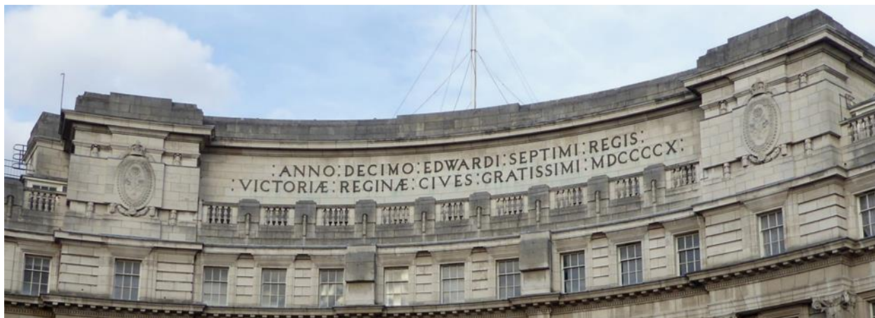
Figure 1: Admiralty Arch in London